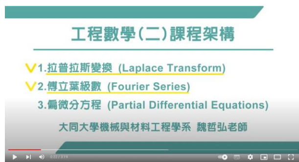
以投影片授課，建議採用 PPT 或螢幕錄製