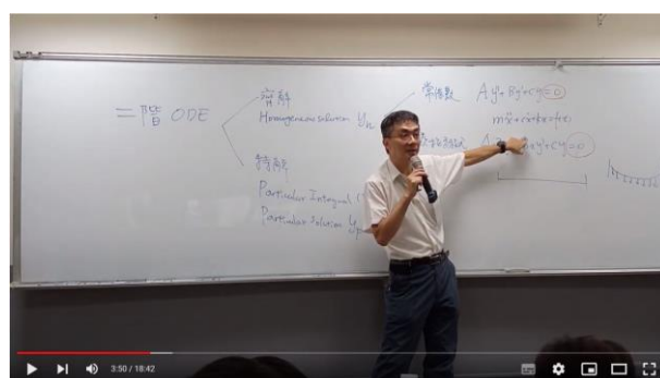
拍攝畫面明亮、文字清晰易於閱讀， 影片經過分段剪輯，時數適中