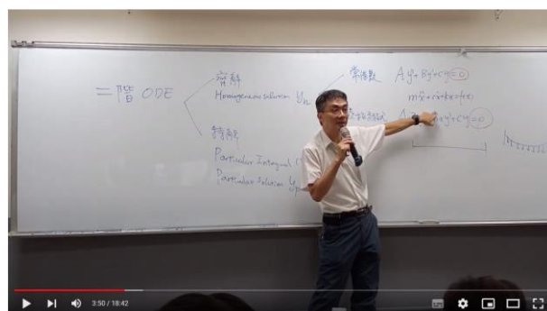
拍攝畫面明亮、文字清晰易於閱讀， 影片經過分段剪輯，時數適中