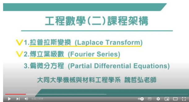
以投影片授課，建議採用 PPT 或螢幕錄製